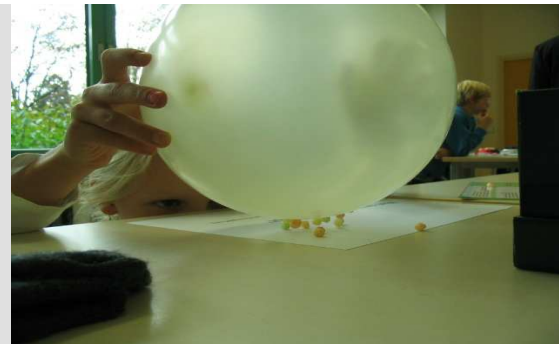
Hier geht es um die statische Aufladung von Gegenständen.

Auch in diesem Jahr hat die pro MINT GT gemeinsam mit dem Carl-Miele-Berufskolleg wieder einen MINT-Mitmach-Tag veranstaltet. Der Aktionstag hat am Samstag, 19. November im Carl-Miele-Berufskolleg in Gütersloh stattgefunden. Das Bildungsbüro war mit der Initiative „Haus der kleinen Forscher“ dabei. An verschiedenen Stationen zum Thema Luft und Energie/ Elektrik konnten die Kinder mit ihren Eltern ausprobieren und experimentieren.