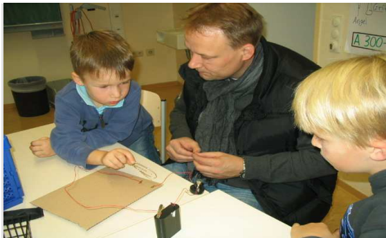
Hier versuchen sich zwei kleine Forscher mit Hilfe ihres Vaters an einem Stromkreis.