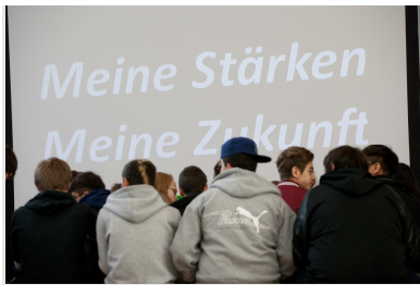
Die Schülerinnen und Schüler am Begrüßungsterminal