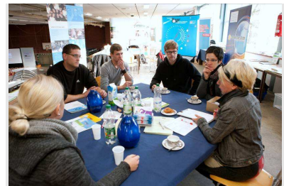
Lehrkräfte bei der Nachbereitung

Zum vierten Mal machte das Projekt „Komm auf Tour – meine Stärken, meine Zukunft“ im Kreis Gütersloh Station (siehe Bericht aus dem letzten Newsletter).