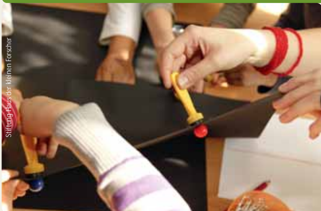
Stiftung Haus der kleinen Forscher