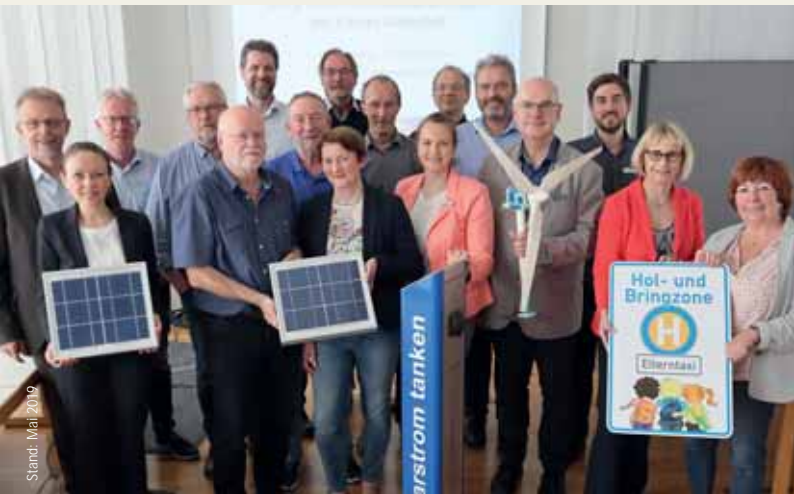
Die Lenkungsgruppe des Integrierten Klimaschutzkonzeptes des Kreises Gütersloh.

Weitere Informationen zu den Projekten rund um die Themen Energie, Klima- und Ressourcenschutz und klimafreundlicher Mobilität erhalten Sie im Internet unter: