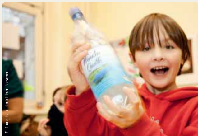
Stiftung Haus der kleinen Forscher

In der Fortbildung wird deutlich, dass beim Forschen und Entdecken naturwissenschaftliche und sprachliche Förderung besonders gut miteinander verbunden werden können.