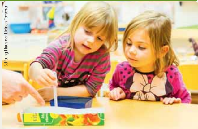
Stiftung Haus der kleinen Forscher