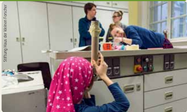
Stiftung Haus der kleinen Forscher