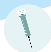
захисне щеплення від коронавірусу

Більше інформації на сайті corona-schutzimpfung.de