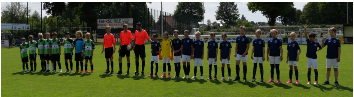
(Bilder: Landrats-Cup 2023 in Kaunitz)