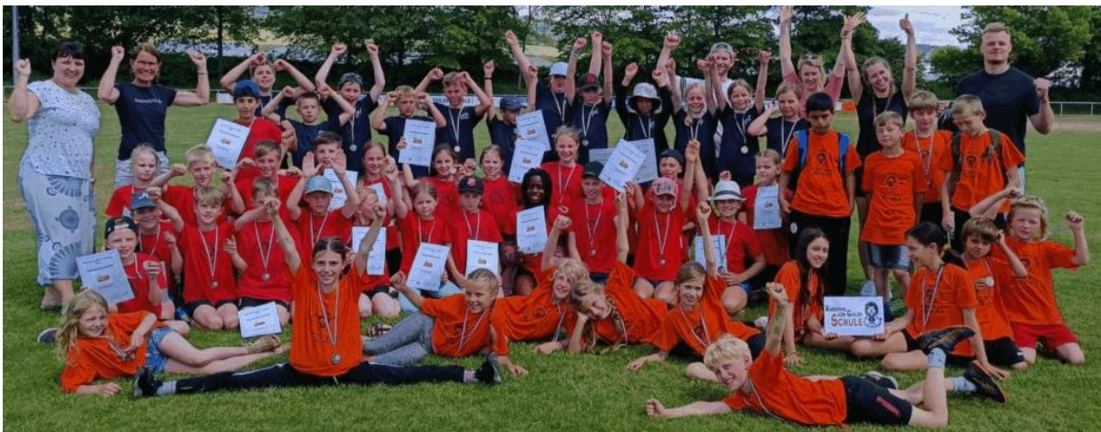
Teilnehmer aus dem Kreis Gütersloh beim Bezirksfinale 2023 in Bad Salzuflen