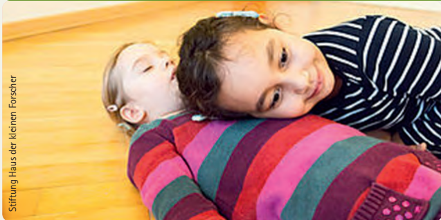
Stiftung Haus der kleinen Forscher

Ob es um unser äußeres Erscheinungsbild oder um die Vorgänge in unserem Inneren geht, unser Wohlbefinden hängt ganz empfindlich von unserem Körper ab.