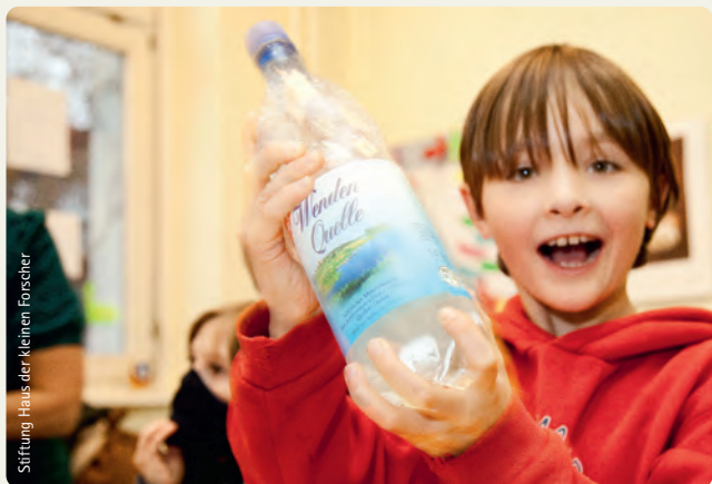
Stiftung Haus der kleinen Forscher

In der Fortbildung wird deutlich, dass beim Forschen und Entdecken naturwissenschaftliche und sprachliche Förderung besonders gut miteinander verbunden werden können.