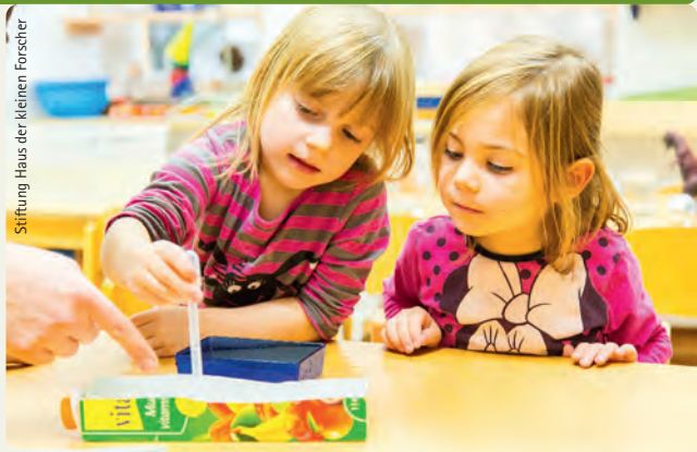
Stiftung Haus der kleinen Forscher