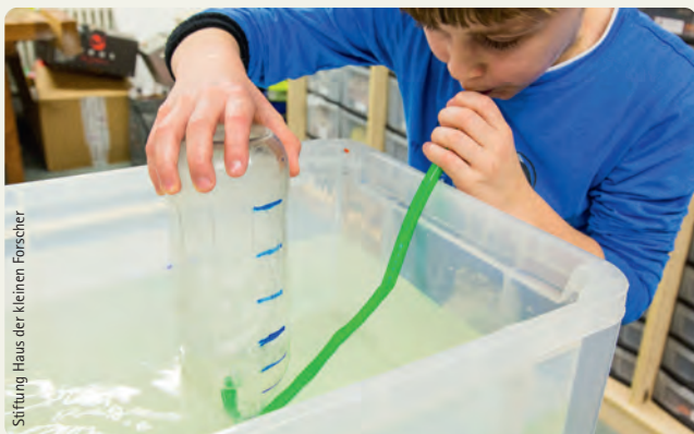
Stiftung Haus der kleinen Forscher

Sie arbeiten mit der Methode „Forschungskreis“, tauschen sich über Erfahrungen aus und üben Fragen zu stellen, die das metakognitive Denken anregen.