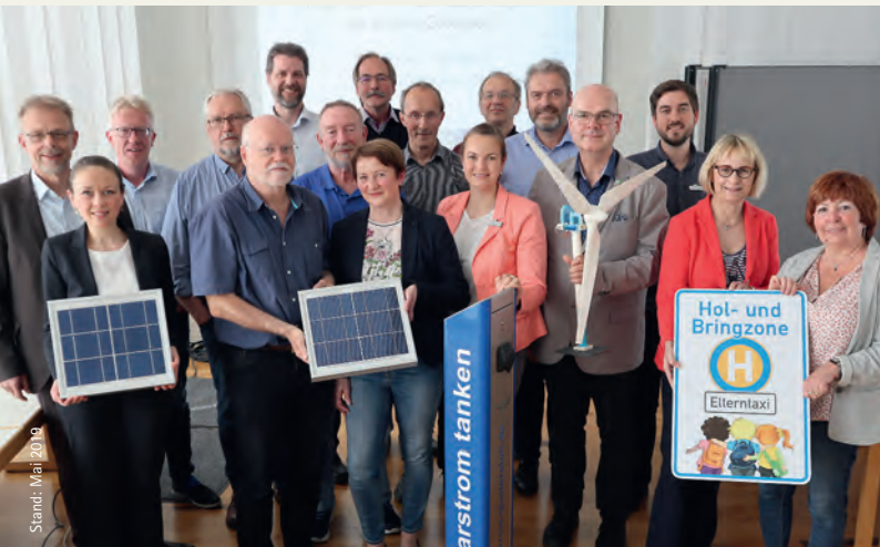
Die Lenkungsgruppe des Integrierten Klimaschutzkonzeptes des Kreises Gütersloh.

Aktuell wird das Integrierte Klimaschutzkonzept des Kreises fortgeschrieben und soll im Sommer 2022 durch den Kreistag beschlossen werden. Die Klimabildung wird auch in der Fortschreibung einer der Schwerpunkte sein.