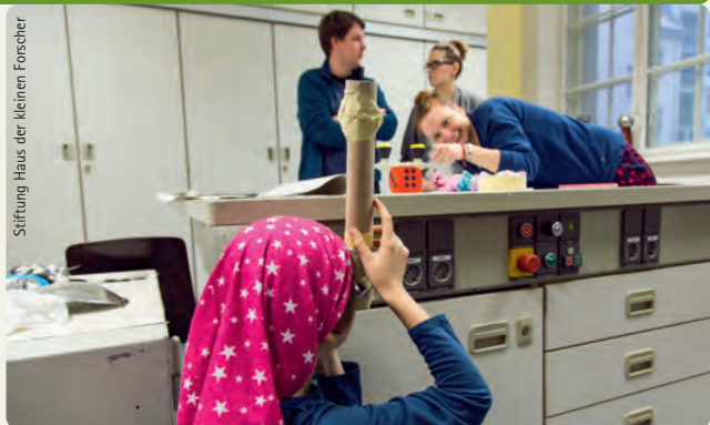
Stiftung Haus der kleinen Forscher