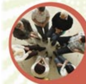
Vermittlung in Selbsthilfegruppen