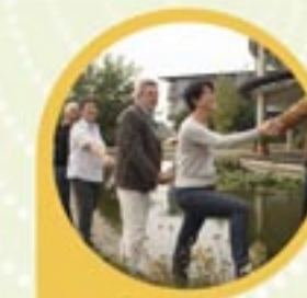
Hilfe bei der Gründung von Selbsthilfegruppen