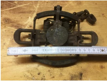
Tellereisen = Verboten!