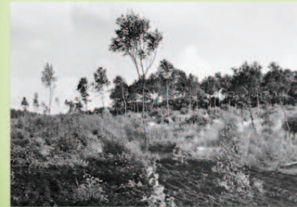
Die vielen kleinen Stämme aus einem Stock lassen die ehemalige Niederwaldbewirtschaftung erkennen. Dieser Wald ist durch eine althergebrachte Verjüngungsform, das "Stockausschlagverfahren" entstanden. Im Zyklus von bis zu 25 Jahren wird abschnittsweise der Bestand bis auf einzelne Bäume (Überhälter) abgeholzt und als Brennholz genutzt.