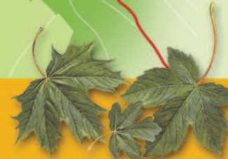
Spitzahorn Feldahorn Bergahorn